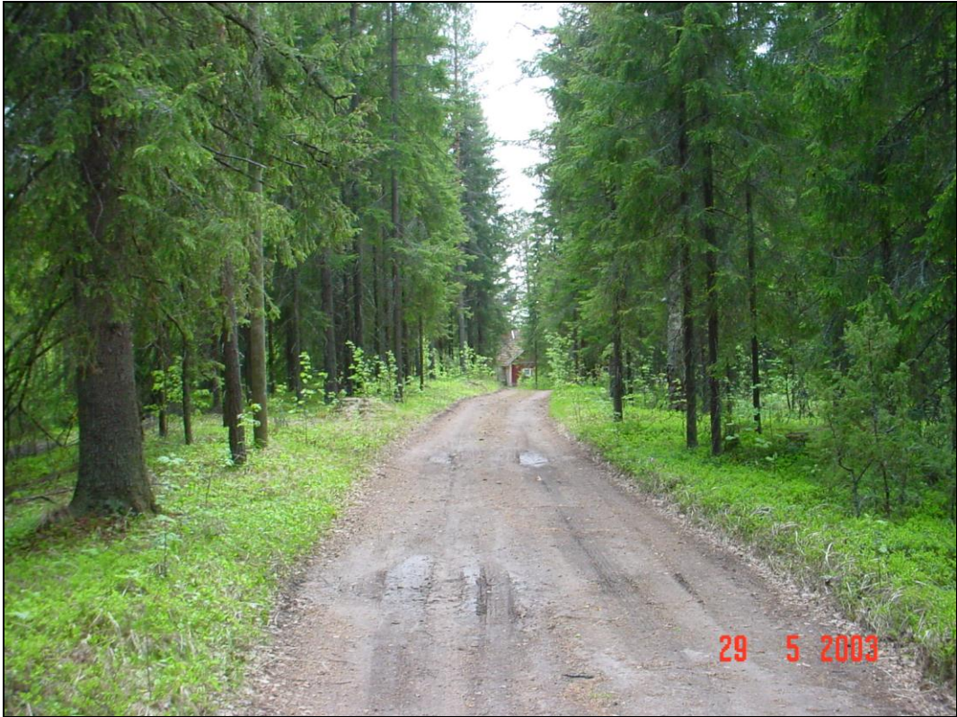
Harjun korkeinta lakea, kuvattu etelään vanhan riihen tms. kohdalta.